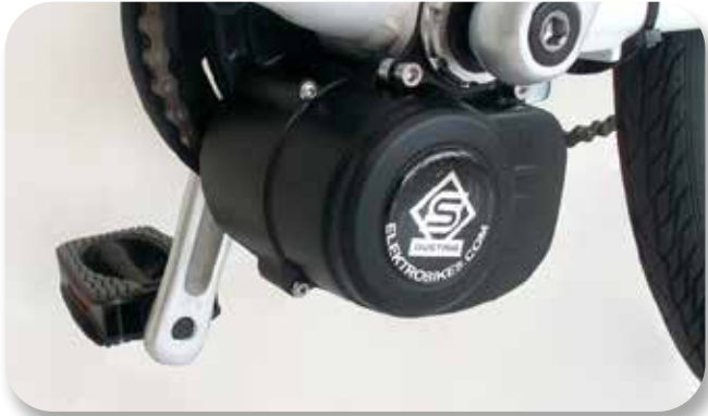
BÜRSTENLOSER MITTELMOTOR mit integrierter Steuerung

auch mit Rücktrittbremse und Gasgriff erhältlich