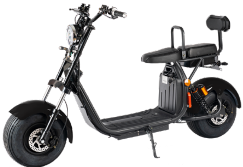
Modell mit zwei Akkus