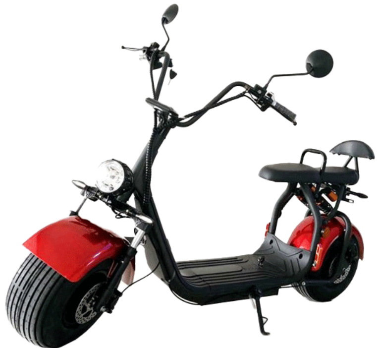
Modell mit einem Akku