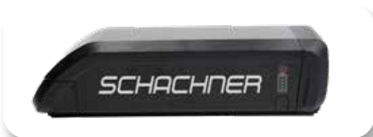
Rahmenakku 15 Ah, ca. 2,5 kg