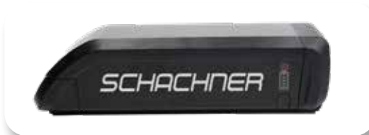
Rahmenakku 15Ah, ca. 2,5 kg